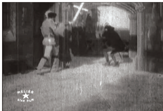
Abbildung 3.1: Der Edelmann verjagt den Teufel in Le manoir du diable (1896)

Marie Georges Jean Méliès, professioneller Zauberünstler von Beruf, begegnete 1895 dem Cinématographen der Brüder Lumière und war von dessen bewegten Bildern fasziniert. Bereits im Jahr darauf veröffentlichte er seine ersten selbst gedrehten Filme, welche von ausgesprochen experimenteller Natur waren. Seiner großen Leidenschaft für die Vorspiegelung falscher Tatsachen entsprechend zeigte Méliès keineswegs das Leben, sondern widmete sich stattdessen den Träumen - Méliès konnte das Zaubern nicht lassen 1 .