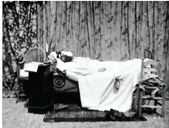
Abbildung 3.2: Une nuit terrible (1896): Der Käfer klettert auf das Bett des Schlafers

Aber in einem Detail ist schon dieser Film durchaus modern, wenngleich auch in einem eher negativen Sinn. Denn auch in Une nuit terrible (1896) ist das Monster der eigentliche Hauptdarsteller des Films. Die an einer Angel hängende Käferpuppe mit ihren beweglichen Beinchen bleibt in der Erinnerung haften, und nicht etwa der aktiv handelnde Mensch. Allerdings war das damals noch nicht so peinlich wie heute, denn, wie bereits gesagt, waren damals die Effekte das Einzige, was für das Publikum zählte. Und bewegte Bilder an sich waren bereits ein grandioser Spezialeffekt, an welchen man sich nicht so schnell gewöhnte. Die Glaubwürdigkeit eines Effekts war absolut zweitrangig.