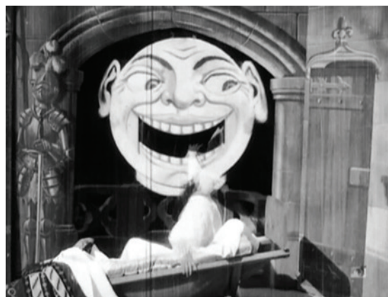
Abbildung 3.4: Selbst der Vollmond wird zu einer Schreckensgestalt und beißt den Schläfer in die Hand: Le Cauchemar (1896)

Wie man sich leicht denken kann, spielte der Horror in den frühen Tagen des Kinos nur eine untergeordnete Rolle. Für das Grauen war damals absolut kein Platz im Reich der technischen und visuellen Tricks; Staunen war angesagt, nicht Gruseln. Die meisten Filmemacher, allen voran die Lumières, konzentrierten sich auf die Dokumentation des Lebens und der Umwelt. Nur Méliès, der Zauberer, erkannte Film als Ausdrucksform der Fantasie, Gemälden ähnlich und keineswegs nur Fotografie. Dementsprechend bildeten die Filme von Georges Méliès auch die einzigen Abstecher des Erscheinungsjahres 1896 in den Horrorfilm. An dieser praktisch nicht vorhandenen Präsenz des Horrorfilms abseits der Vorstellungskraft des genialen Franzosen sollte sich auch in den nächsten Jahren nicht allzu viel ändern.