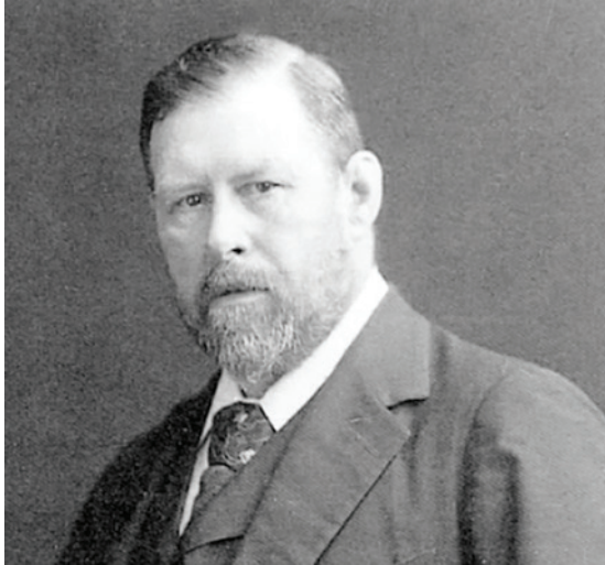
Abbildung 4.2: Bram Stoker

in Méliès Film in Gestalt einer Fledermaus herumflatterte, wurde mit Vlad Țepeș gekreuzt. Hierzu mischte Stoker dem Ganzen noch eine Ladung literarische Vorbilder wie Le Fanus Carmilla sowie einen gehörigen Schuss Vampirlegenden des Balkans zu.