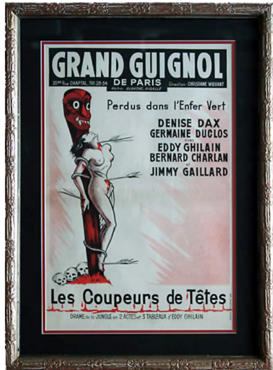
Abbildung 4.3: Plakat einer Aufführung des Théâtre du Grand-Guignol aus dem Jahr 1960, aus der Sammlung von Eric Horton

Die Aufführungen unterschieden sich inhaltlich nur wenig von den Slasher -, Gore - und Torture-Porn -Streifen, welche seit den 70er Jahren des 20. Jahrhunderts oft in den Kinos anzutreffen sind. Letztlich handelt es sich beim Théâtre du Grand-Guignol um den Urahn von Filmen wie The Incredible Torture Show (1958) , Dawn of the Dead (1978) , Friday the 13th , E tu vivrai nel terrore - L'aldilà (1981) , oder Saw (2004) . Aber eine Komponente des Theaters machte den Besuch zu einer grenzwertigeren Erfahrung, als es Filme zu tun vermögen - das Geschehen auf der kleinen, etwa 7x7 Meter großen Bühne war live und das Theater mit seinen lediglich 285 Sitzplätzen intimer, als es Kinos in der Regel waren. Wer in den vorderen Reihen saß, hatte oft das zweifelhafte Vergnügen, mit Kunstblut und Schlachtabfällen aus den Metzgereien