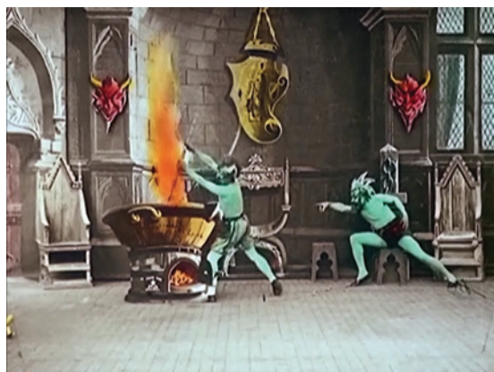
Abbildung 13.7: Le chaudron infernal (1903) : Der Kochtopf ist einsatzbereit

Der Teufel hat drei junge Frauen gefangen. Eine nach der anderen wird von ihm und seinen Schergen in einen großen Kochtopf gesteckt und zu Tode gekocht.