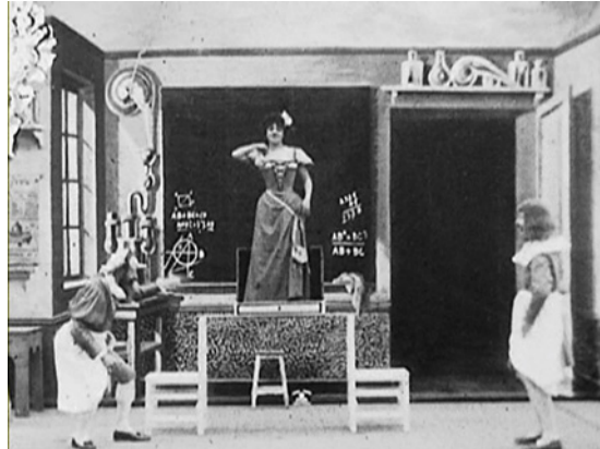
Abbildung 13.3: George Méliès (links) und Jeanne d'Alcy in La boîte à malice (1903)

In La boîte à malice (1903) 26 zeigt Georges Méliès wieder einen Zaubertrick, realisiert durch Teilmaskierungen des Bildes. Mit einem Gehilfen legt er eine flache Schachtel auf eine dünne Glasplatte und Jeanne d'Alcy tritt hinein. Langsam verschwindet sie daraufhin in der Schachtel. Der Deckel klappt zu, die Frau ist verschwunden. Auch Georges Méliès verschwindet auf diese Weise.