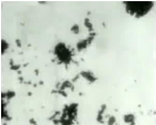
Abbildung 13.1: Der große Fleck links oberhalb der Bildmitte ist eine der winzigen Hauptdarstellerinnen aus The Cheese Mites (1903) . Der Kopf zeigt nach rechts unten

ster. Käsehersteller beschwerten sich über den Film, weil man befürchtete, dass die Käufer den Gedanken, dass achtbeinige Käfer auf dem Käse leben, überhaupt nicht mögen würden. Doch das Publikum war verrückt nach den gruseligen Biestern. Mikroskope fanden in London einen vermehrten Absatz und wurden oftmals auch zusammen mit einem Beutel Milben zum Kauf angeboten. The Cheese Mites (1903) selbst ging als der erste ernsthafte wissenschaftliche Lehrfilm in die Geschichte ein.