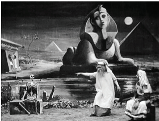
Abbildung 13.5: Der Zauberer erweckt das Skelett zum Leben, Le monstre (1903)

Le monstre (1903) 32 ist ein sehr spaßiger Film, der in der Kulisse von L'oracle de Delphes (1903) entstand. Ein ägyptischer Prinz bietet einem Zauberer eine große Belohnung an, wenn er ihm ermöglicht, noch einmal seine verstorbene Ehefrau zu sehen. Der Zauberer nimmt das Angebot an und beschafft das Skelett der Toten. Dann beschwört er den Mond und die klapperigen Gebeine der Frau beginnen sich zu bewegen ... das Monster erwacht.