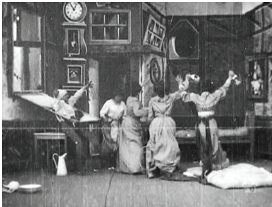
Abbildung 13.4: Ein heilloses Durcheinander in L'auberge du bon repos (1903)

L'auberge du bon repos (1903) 28 ist eine klassische Spukhaus-Geschichte im Stil vieler älterer Produktionen von Georges Méliès wie L'auberge ensorcelée (1897) . Ein müder Reisender wird in ein Zimmer einer Herberge geleitet und möchte sich zur Ruhe begeben. Doch dann setzt ein eigenartiges Treiben ein. Doch im Gegensatz zu früheren Werken Méliès', in welchen der Protagonist in der Regel aus Angst flüchtete, wird jener aus L'auberge du bon repos (1903) ausgesprochen handgreiflich. Da wird mit einem Kleiderständer gekämpft, eine Fensterscheibe zersplittert, ein gespenstisches Gemälde geht zu Bruch ... kurz: Das Zimmer wird verwüstet und der Reisende am Ende von den anderen Bewohnern verjagt.