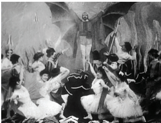
Abbildung 13.8: Die Tänzerinnen huldigen in der letzten Szene von Le chaudron infernal (1903) ihrem Meister. Beachten Sie die herrlichen Fledermausflügel, welche Méliès hier trägt

Der Film lebt von seinen Darstellungen des Geistes, der frei im Raum schwebt und durch schnelle Schnitte auch sein Aussehen verändert. Ansonsten bietet Le revenant (1903) keine neuen Erfahrungen.