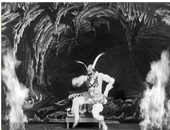
Abbildung 13.2: George Méliès tanzt in der Rolle des Teufels in Le cake-walk infernal (1903) über die Leinwand

zunehmende wirtschaftliche Bedrängnis. Die Raubkopierer, allen voran Siegmund Lubin, setzten ihm schwer zu; Georges Méliès lebte vom Verkauf seiner Filme, und jede nicht von ihm hergestellte Kopie war somit ein Umsatzdefizit, was durchaus noch existenzbedrohend hätte werden können. Und in Frankreich erwuchs ihm mit Pathé Frères eine ernst zu nehmende Konkurrenz. Auf die Kopierer antwortete Méliès, indem er das Symbol der Star Film zunehmend in die Kulissen seiner Filme selbst einbaute, und natürlich auch durch die Eröffnung des New Yorker Büros und somit einer unmittelbaren Inanspruchnahme des amerikanischen Urheberrechts. Auf die inländische Konkurrenz reagierte er mit einer Erhöhung der Produktionszahlen. Und so dominierte Georges Méliès beim fantastischen Film auch das Jahr 1903.