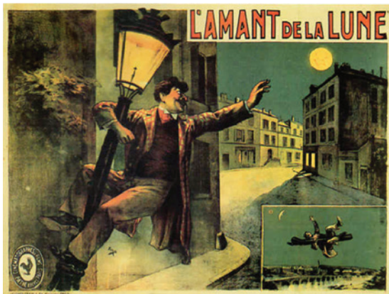
Abbildung 16.5: L'amant de la lune (1905) , französisches Filmplakat

Auch über L'antre infernal (1905) 14 ist nichts bekannt. In diesem Film, welcher in der Hölle spielte, beschwor der Teufel zwei Frauen. Das British Film Institute listet den Film zudem mit dem alternativen Titel Skeleton Magician , was im Falle der Korrektheit auch auf das Vorhandensein von Skeletten schließen ließe. Der Film soll auch in Farbe gehalten gewesen sein, aber es ist nicht klar, ob dies eine Handkolorierung war oder ein anderer Prozess - es ist nicht ausgeschlossen, dass L'antre infernal (1905) zusammen mit einer anderen Produktion der Pathé namens L'arête malencontreuse (1905) ein Feldversuch mit dem Dussaudscope war, einer Erfindung des Genfer Gelehrten François Dussaud. Es ist überliefert, dass Dussaud seit dem Jahr 1900 im Dienst der Pathé stand und an einer Technik forschte, um Filme in Farbe zu drehen.