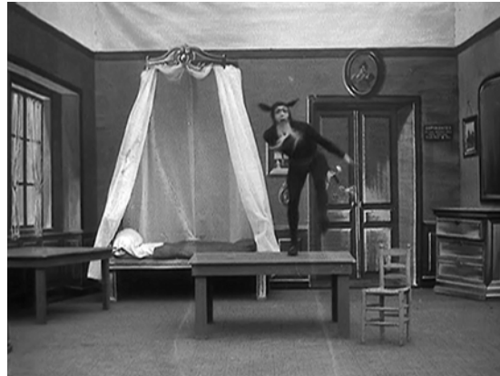
Abbildung 16.4: Le diable noir (1905) treibt seinen Schabernack

Ein Gast betritt das Zimmer und möchte es sich gemütlich machen. Doch natürlich klappt das nicht. Tische werden aufeinandergestapelt, der Stuhl vermehrt sich und liefert sich ein Wettrennen mit dem Gast und am Ende liegt das Mobiliar in Trümmern, das Bett steht in Flammen und die erzürnten Hotelangestellten ziehen dem vermeintlichen Störer die Ohren lang.