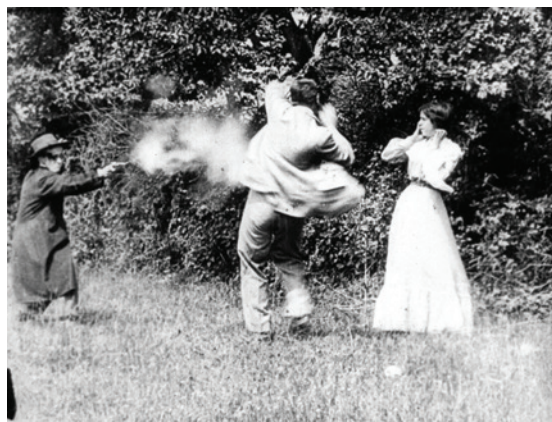
Abbildung 16.1: Charles Peace erschießt Mr. Dyson vor den Augen seiner Frau. Szene aus The Life of Charles Peace (1905) von William Hagggar [6]

In Sheffield gedreht, wo Charles Peace tatsächlich auch lebte, erlebte der Film seine Aufführungen im Rahmen von Hagggars Bioscope-Wanderausstellung auf walisischen