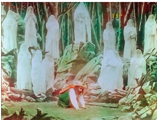
Abbildung 16.3: In der Traumsequenz aus La légende de Rip Van Winkle (1905) wird der Titelheld von Geistern bedroht

La légende de Rip Van Winkle (1905) 10 ist etwas besser ausgefallen, wenngleich man auch hier noch einen begleitenden Erzähler benötigt, um den Inhalt der Geschichte zu verstehen.