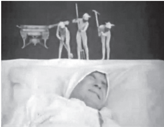
Abbildung 17.6: Kleine Teufelchen quälen den Vielfraß aus The Dream of a Rarebit Fiend (1906)

Edwin S. Porter inszenierte in Zusammenarbeit mit Wallace McCutcheon ein Stück mit dem Titel The Dream of a Rarebit Fiend (1906) 22 für die Edison Manufacturing Company. Der Film entstand nach einem Comicstrip des Zeichners Winsor McCay und hat Ähnlichkeiten mit Pathés L'amant de la lune (1905) aus dem Vorjahr.