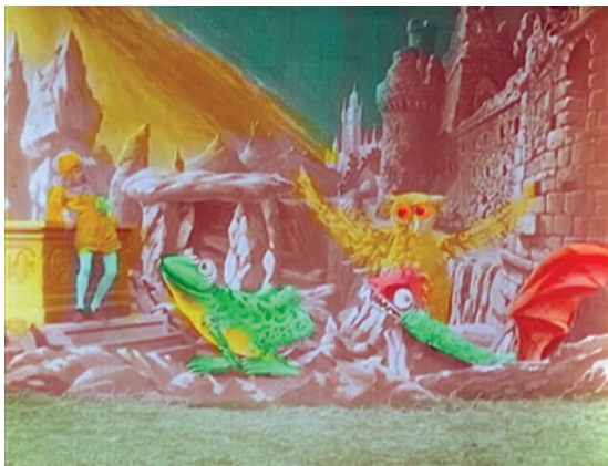
Abbildung 17.3: Monster greifen an: La fée Carabosse, ou le poignard fatal (1906)

Der überraschenderweise wahrhaft großartige Beitrag von Georges Méliès zur Fantastik des Filmjahres 1906 ist La fée Carabosse, ou le poignard fatal (1906) 4 . Hier blitzt das Genie, welches das Publikum zu seiner Zeit wiederholt verzauberte, wieder auf.