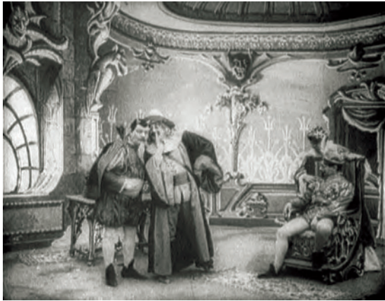
Abbildung 17.5: Satan, Snagarelle und der gelangweilte Sohn in Le fils du diable fait la noce à Paris (1906)

Le fils du diable fait la noce à Paris (1906) 13 ist ein weiterer Film mit der Kamerarbeit und den Spezialeffekten von Segundo de Chomón.