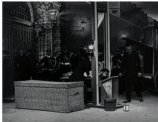
Abbildung 17.4: Noch eine Sekunde, dann fällt in Les incendiaires (1906) das Beil

Die noch vorhandenen Fragmente zeigen, wie Banditen eine Farm in Brand setzen. Die Polizei belagert ihr Versteck, doch die Verbrecher fliehen. Einer von ihnen wird jedoch gefangen und eingesperrt. Im Gefängnis hat er einen Albtraum von einer Guillotine. Dann wird sein Gnadengesuch abgelehnt und die Guillotine vorbereitet. Der Gefangene wird hereingeführt und auf die Guillotine gespannt. Das Beil fällt, der Kopf auch, und der Leichnam wird in einem Bastkorb abtransportiert.