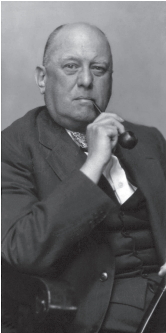
Abbildung 18.2: Aleister Crowley

verantwortlich für den Okkultismus in der Form, wie wir ihn heute kennen; die Konzepte der Magie, ihrer Rituale und neureligiöse Ausprägungen wie Wicca , die Religion der Hexen, oder Thelema sind auf den Orden zurückzuführen. Ebenso beschäftigten sich die Mitglieder mit Alchemie, henochischer Magie, dem Tarot , Astralreisen und dem Wahrsagen mithilfe von Kristallkugeln. Vor allem jedoch lieferte der Hermetic Order of the Golden Dawn Inhalte und Ideen .