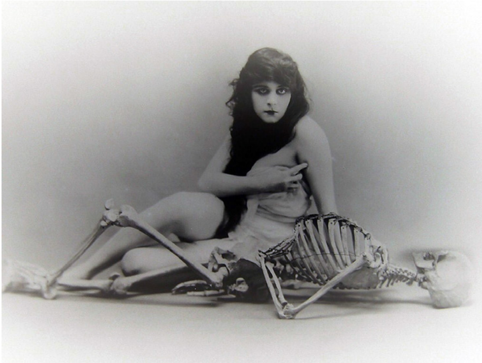
Abbildung 22.4: Theda Bara, der erste Sex-Vamp Hollywoods

auch nicht davor, sie in höchst anstößigen Bildern zu zeigen. Berühmt wurden Theda Baras kontroverse Fotografien, in welcher sie sich als Vampir darstellen ließ, oder gar sexuelle Abenteuer mit einem Skelett angedeutet wurden.