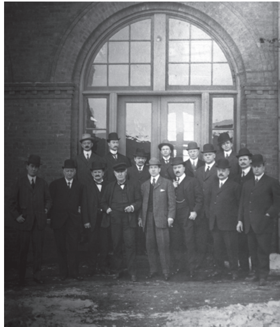
Abbildung 22.2: Die Gründungsmitglieder der MPPC, Thomas Edison ist der grimmig dreinschauende vierte Herr von links in der vorderen Reihe

Um hier mehr Kontrolle auf dem Markt ausüben zu können, gründete die MPPC die General Film Company , welche die großen Filmverleiher der USA ausbezahlte. Insgesamt gab es 52 Übernahmen. Hiermit war dann endgültig ein Kartell geschaffen, welches die Kinobesitzer zwang, an dem Verleihmodell teilzunehmen. Wer nicht mitmachte, egal ob als Produzent, Verleiher oder Aussteller, erhielt keine Produkte der MPPC mehr - kein Filmmaterial, keine Filme, keine Projektoren. Ebenso schalte-