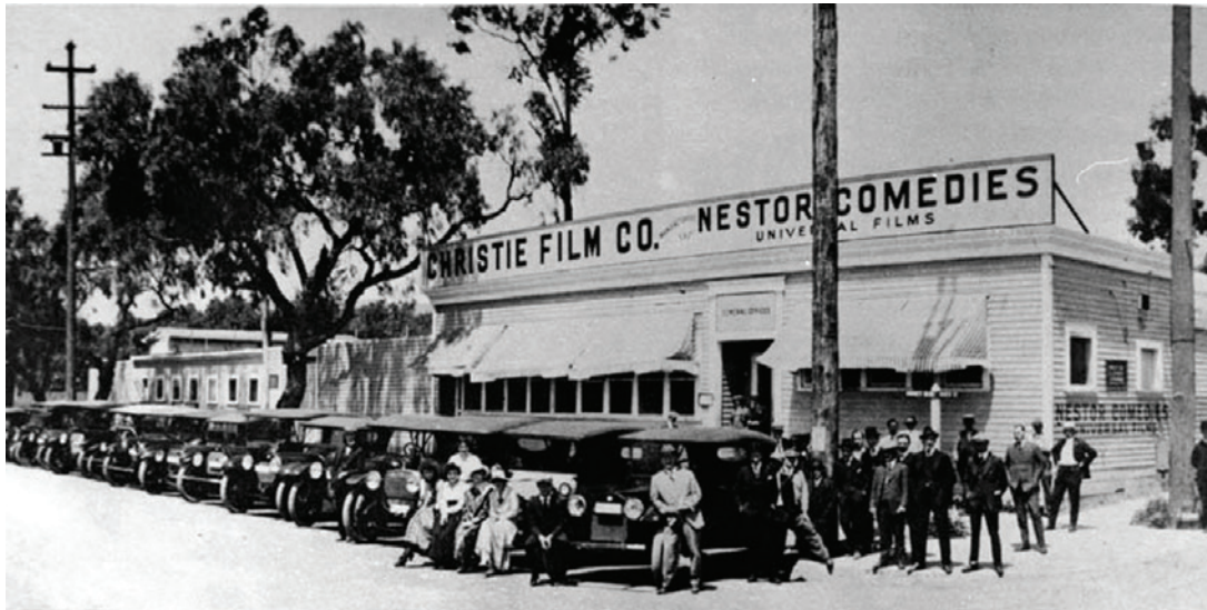
Abbildung 22.3: Ansicht der Nestor Studios kurz nach der Fusionierung mit IMP im Jahr 1913

während die MPPC aufgrund ihres Geschäftsmodells des lizenzpflichtigen Verleihs von Filmen mit maximal einer Filmrolle Länge festhielt. Bis 1915 weitete die MPPC diese Vorgabe zwar auch auf mehrere Rollen aus, aber dies geschah rein reaktiv und auch nicht rechtzeitig genug.